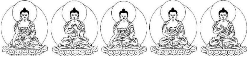
[Bát Động Phật] [Đại Nhật Phật] [Bảo Sinh Phật] [A Di Đà Phật] [Bát Không Thành Tựu Phật]

Quán tượng ở không gian trước mặt là vị thầy bốn sư của quý vị, mang sắc tướng của đức Phật Thích Ca Mâu Ni. Giữa tim Phật là đức Thiên Thủ Quan Thế Âm [ngàn tay]. Giữa tim đức Thiên Thủ Quan Thế Âm là linh tự HRIH, và từ linh tự này phóng ra từng luồng ánh sáng lớn, tạo thành sáu hàng nơi không gian phía dưới. Cuối mỗi luồng ánh sáng là một pháp tòa kết bằng ngọc báu, được voi lớn đội lên. Trên mỗi pháp tòa là một đức Phật.