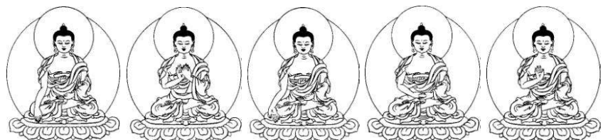
[Akshobhya] [Vairochana] [Ratnasambhara] [Amitabha] [Amoghashiddhi]

Visualize in the space in front of you your Guru in the aspect of Shakyamuni Buddha, with thousand-arm Chenrezig at his heart. At the heart of thousand-arm Chenrezig is the syllable HRIH, and from this beams of light emanate, forming six rows in the space below. At the end of each beam is a throne supported by elephants and adorned with pearls. On each Vairochana throne is seated a buddha.